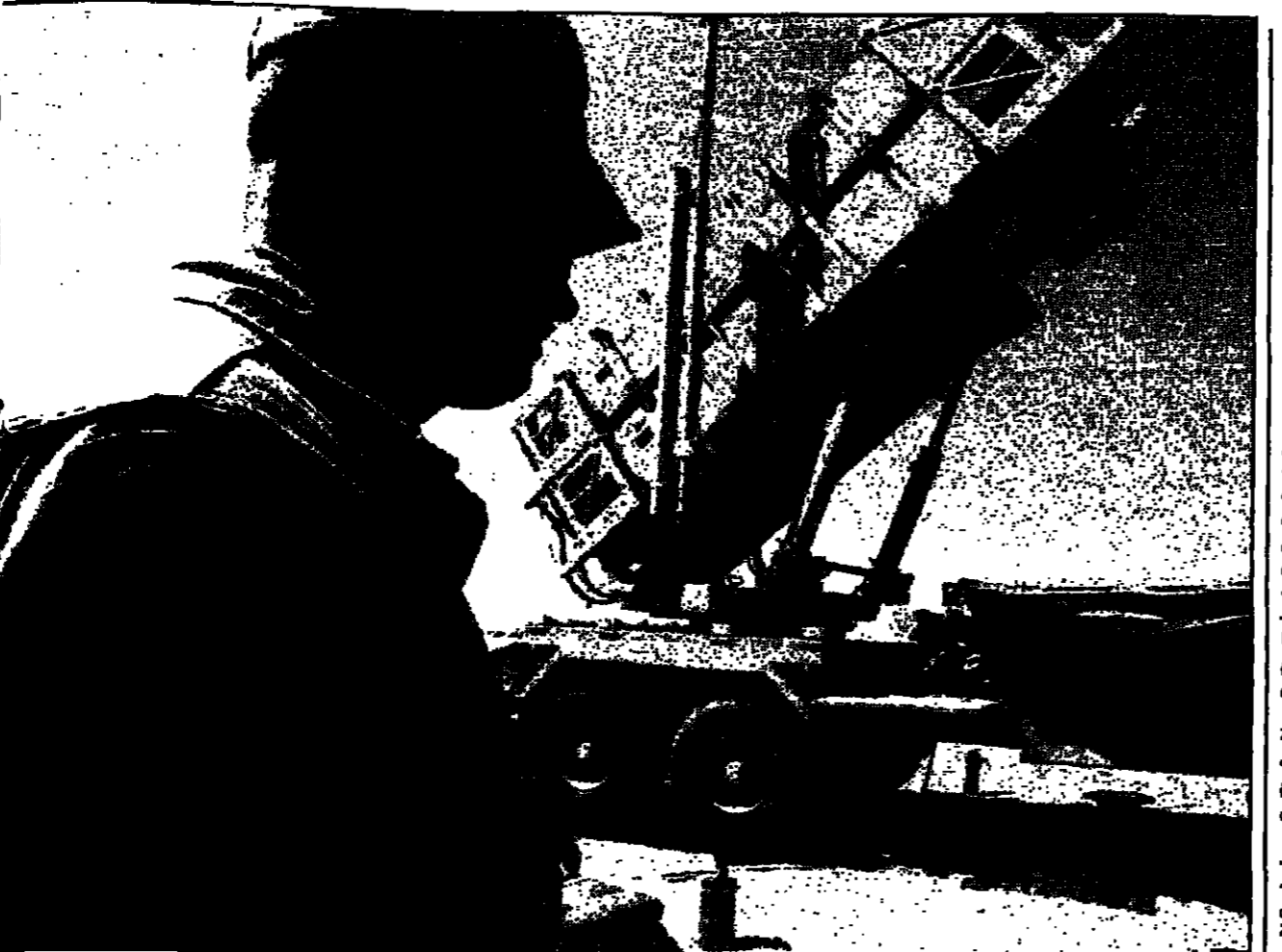
جنسي أمريكي أمام منصة صواريخ باتريوت التي نشرتها الكويت والسعودية والسرايل

شاملة لخطر التجارب النووية. وفي أوروبا فإن هدف حكومة الرئيس كلينتون الرئيس هو توطيد الاستقرار في القارة بحزب جديد شمال الأطلسي (الناتو) ولتحقيق التطويق اسامه للقيام بعمليات جديدة، ويصعد السوفييتون الأمريكيون الأزمة الأخيرة في القديم كسوقاً باعتبارها الخطوة الكبيرة تجاه كوسوفو، وأشار جيمس شتاينبرغ، نائب رئيس مجلس الأمن القومي بالبيت الأبيض مؤخراً، الى أهمية حلف الناتو بقوله ما ليس هو الحركة الرئيسية ويمتد الى الأرباب في العالم اعتباراً من الآن وحتى انتهاء ولايته الثانية في نهاية عام 2000 وقائمة هذا البرنامج جديدة وبالاحتمال أنها تتضمن مبادرات كثيرة، فقام كلينتون لا يتصور على ما يبدو حدوث مبادرات برلمانية عنك التي قام بها جيمس جانتز لامتدادها، والتي، وبوجه عام، هي محدثات حول الأمن والتعاون في أوروبا، آسيا، أفريقيا، الشرق الأوسط، والاتحاد السوفييتي.